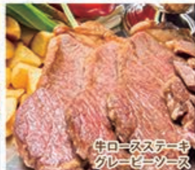
牛ロースステーキ グレービーソース