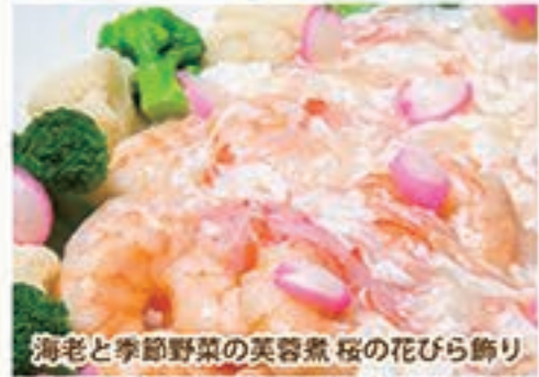
海老と季節野菜の芙蓉煮 桜の花びら飾り

鯛とサーモンのサラダ仕立て 春キャベツとイカのピリ辛炒め 海老と季節野菜の芙蓉煮 桜の花びら飾り 若鶏のオープン焼き 小悪魔風 牛バラ煮散し寿司 滑子と卸しわかめ蕎麦 桜のムースケーキ