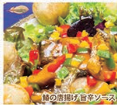
鯛の唐揚げ 旨辛ソース