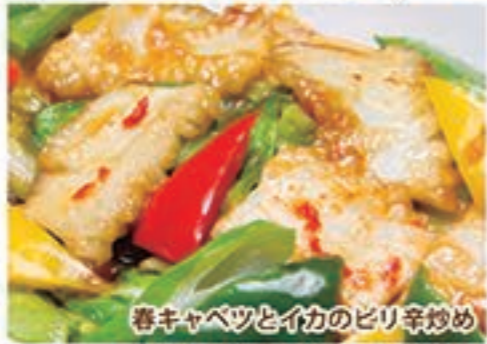
春キャベツとイカのピリ辛炒め