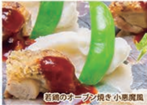
若鶏のオープン焼き 小悪魔風