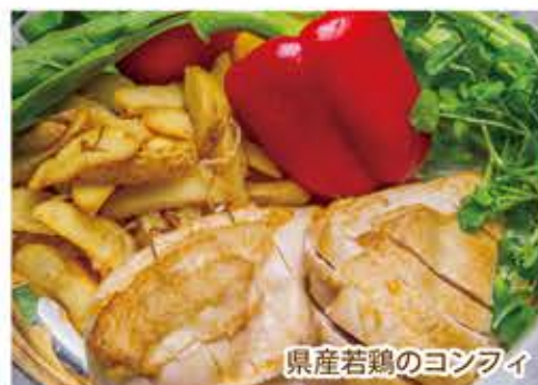
県産若鶏のコンフィ