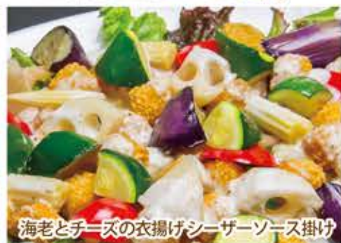
海老とチーズの衣揚げシーザーソース掛け