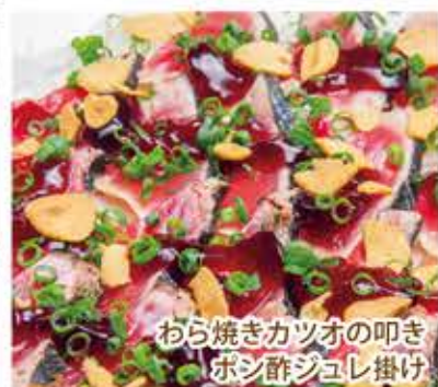
わら焼きカツオの叩き ポン酢ジュレ掛け