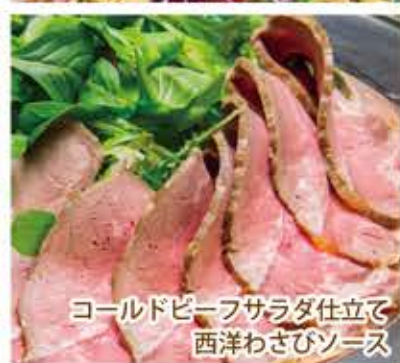
コールドビーフサラダ仕立て 西洋わさびソース