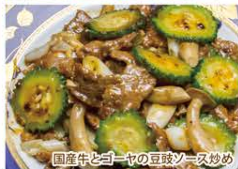
国産牛とゴーヤの豆豉ソース炒め

アボカドと蒸鶏あぶりカルパッチョ 夏野菜とプチモッツァレラのカプレーゼ 海老とチーズの衣揚げ シーザーソース掛け 国産牛とゴーヤの豆豉ソース炒め 県産若鶏のコンフィ 冷しとろろ茶そば タピオカ入り杏仁豆腐